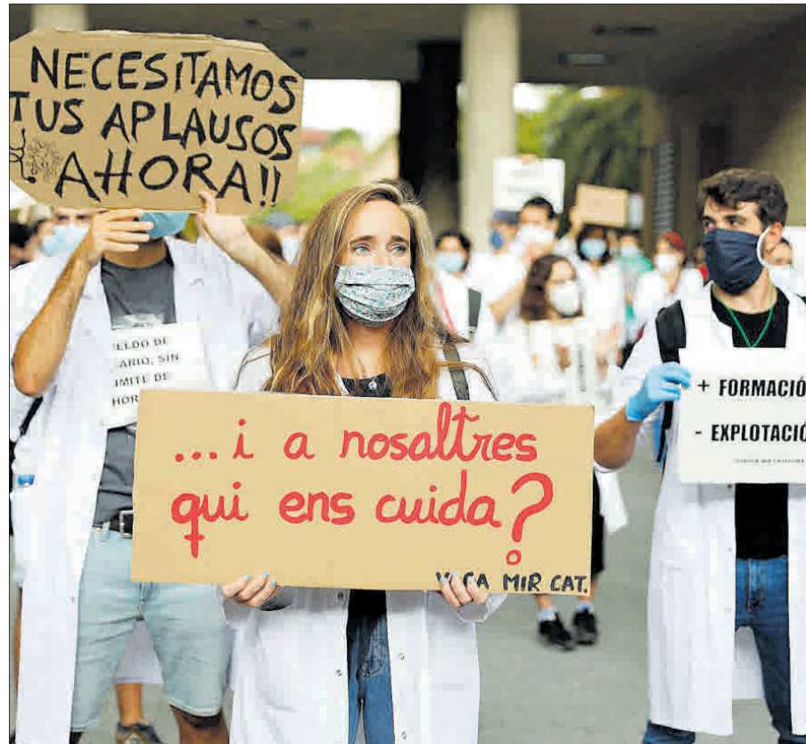
► Concentració de metges interns residents a la Conselleria de Salut, a Barcelona, ahir.