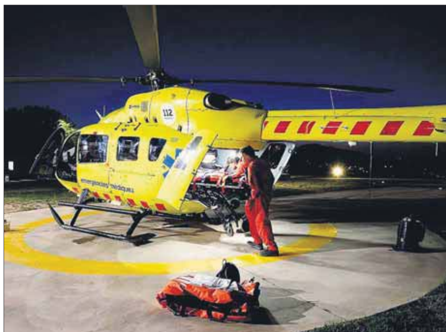
L'hospital ha hagut de fer obres a l'heliport per poder acollir el nou servei

El Departament de Salut confia que l'helicòpter cobrirà el 50% dels trasllats que ara es fan amb ambulància. Per poder tirar endavant aquest servei s'han hagut de fer obres a l'heliport de l'hospital Josep Trueta. Així, s'ha millorat i ampliat l'heli-superfície i s'han fet treballs d'abalisament i il·luminació. A més, també s'ha ampliat amb dues helipistes més, que permeten que en determinats moments hi pugui haver fins a